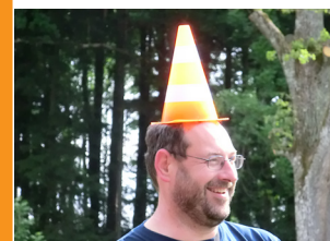
Bei den Obergkeiten war gestern Blödeltag angesagt!