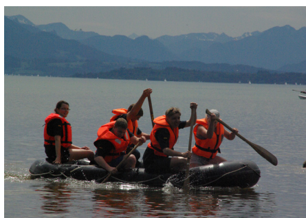
Alle Jahre wieder: Wasserballet vom Feinsten