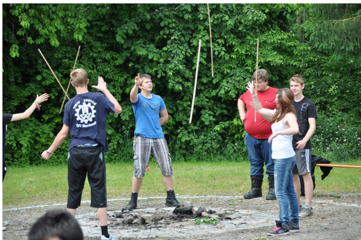
It's all about magic...!

Die Schlaufbootrally konnte unter strahlendem Himmel starten und es wurden super Zeiten eingefahren, jedoch gab es auch Teilnehmer mit Schwierigkeiten! Einige zogen sogar mit Kriegsbemalung in den Wettkampf!