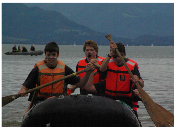
Und eins! Und eins! Und eins! ....

Gegen 9:30 fand die traditionelle Lagerolympiade statt, welche wieder vom OV Landhut ausgerichtet wurde. Die verschiedenen Stationen wurden von den Jugendbetreuern der einzelnen Ortsverbände beaufsichtigt. Bei der Lösung der Aufgaben war der Kreativität keine Grenze gesetzt.